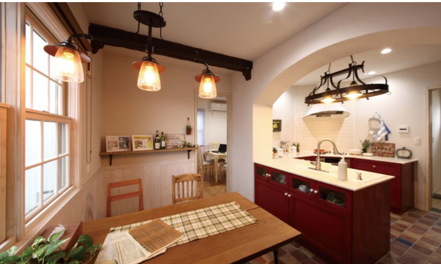
コの字型のキッチンのカウンタートップをダイニングテーブルと対面する形にレイアウト。キッチンに立つママとテーブルに座る家族との会話が弾みます。アンティーク風の照明がお部屋をやさしく照らしてくれます

欧米では年月を経た家は、アンティークとして資産価値が高まります。上質素材と卓越したインテリアセンスを駆使した「ビスコッティハウス」を展開するディーワイブランは、欧米の邸宅のように、時代とともに経年変化を楽しめる上質な住まいを。そして、家全体が居心地の良いカフェやお気に入りのショップのような、くつろぎの空間を提案してくれます。 ビスコッティハウスは、壁材に透湿材を取り入れて、壁と断熱材の間に通気層を設ける「通気断熱WB工法」を標準仕様採用。呼吸する健康住宅として過剰な冷暖房に頼ることなく自然な快適さを維持し、日々のランニングコスト軽減にも貢献するなど、美観はもちろんのこと、永く快適に住み続けるために必要な機能性や快適さにも十分に配慮されています。 ビスコッティハウスの温もりあふれる空間を体感できるモデルハウスは、レストランウエディングを手掛ける会社とのコラボレーションによって2013年にガーデンチャペル・デイルーチェ内に誕生しました。インテリアの参考になるアイデアが満載なので、どうぞお気軽に訪れてみてください。ご結婚を控え新居を検討中のカップルにもおすすめです。