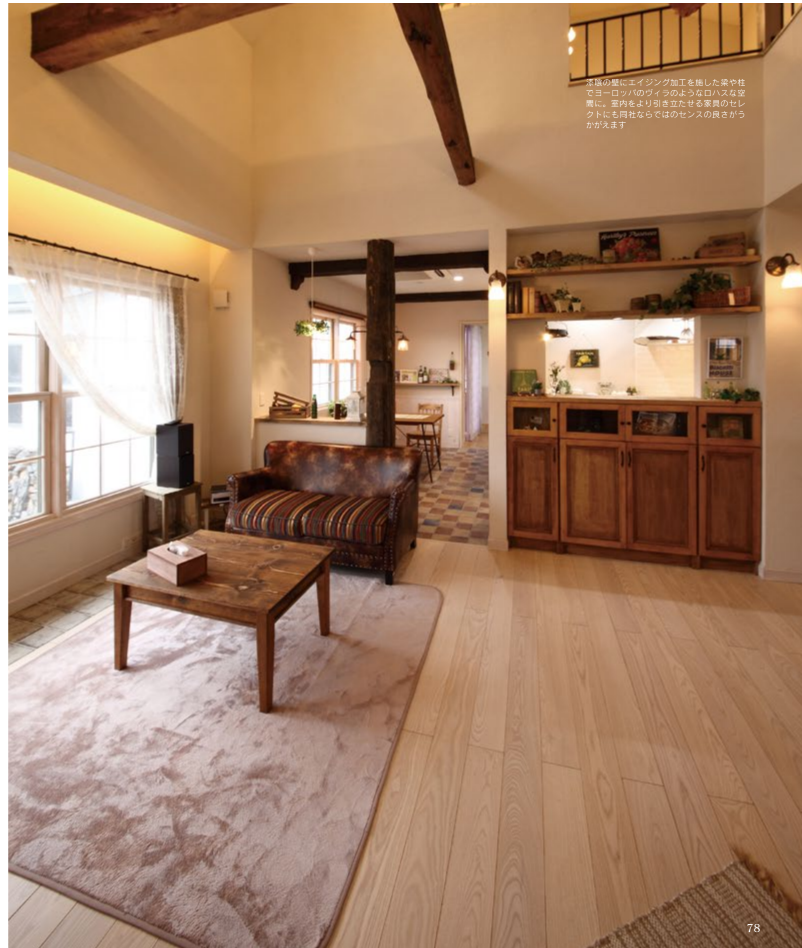
漆喰の壁にエイジング加工を施した梁や柱でヨーロッパのヴィラのようなロハスな空間に。室内をより引き立たせる家具のセレクトにも同社ならではのセンスの良さがうかがえます

欧米では年月を経た家は、アンティークとして資産価値が高まります。上質素材と卓越したインテリアセンスを駆使した「ビスコッティハウス」を展開するディーワイブランは、欧米の邸宅のように、時代とともに経年変化を楽しめる上質な住まいを。そして、家全体が居心地の良いカフェやお気に入りのショップのような、くつろぎの空間を提案してくれます。 ビスコッティハウスは、壁材に透湿材を取り入れて、壁と断熱材の間に通気層を設ける「通気断熱WB工法」を標準仕様採用。呼吸する健康住宅として過剰な冷暖房に頼ることなく自然な快適さを維持し、日々のランニングコスト軽減にも貢献するなど、美観はもちろんのこと、永く快適に住み続けるために必要な機能性や快適さにも十分に配慮されています。 ビスコッティハウスの温もりあふれる空間を体感できるモデルハウスは、レストランウエディングを手掛ける会社とのコラボレーションによって2013年にガーデンチャペル・デイルーチェ内に誕生しました。インテリアの参考になるアイデアが満載なので、どうぞお気軽に訪れてみてください。ご結婚を控え新居を検討中のカップルにもおすすめです。