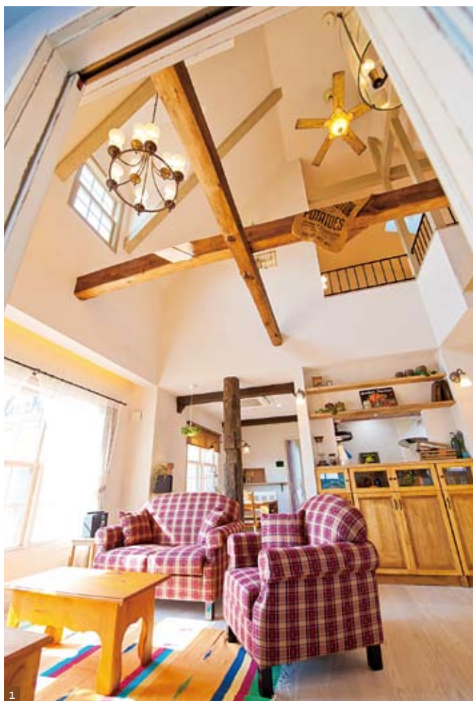
1 無垢材などの自然素材の温もりを感じさせる吹き抜けのリビング。梁に古材を用いて、アンティークな雰囲気を醸し出した。 2 新しいのに、どこか懐かしさを覚える。ビスコッティハウスが得意とする空間演出で形作ったアプローチ。