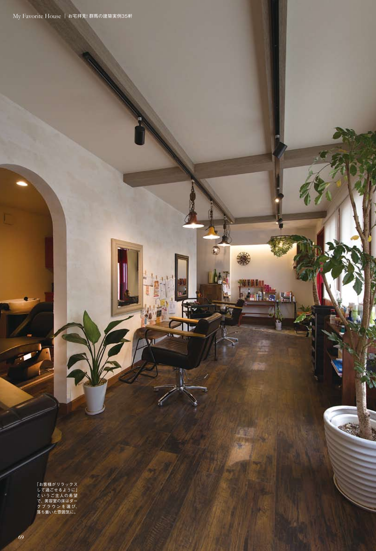
「お客様がリラックスして過ごせるように」というご主人の希望で、美容室の床はダークブラウンを選び、落ち着いた雰囲気に。