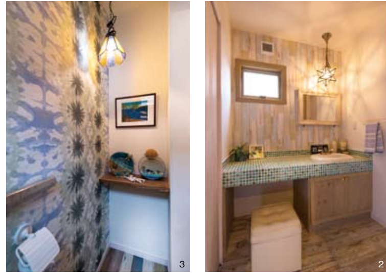
1. 白い壁が庭の芝生やヤシなどのグリーンに映える外観。ブルーの玄関ドアがアクセントとなって、爽やかな印象を与える。 2. 海をイメージさせる色合いのモザイクタイルをセレクトして造った、オリジナル洗面台。 3. 「どこにいても海が感じられるように」(奥様)と、1階のトイレには海をモチーフにした雑貨を並べた。 4. ダイニングテーブルはキッチンと横並びに配置して、効率の良い家事動線を実現。「対面キッチンは子どもの様子が良く見えて安心です」(奥様)。 5. ご夫婦が最もこだわったオーダー水槽。「無機質な機材が一切見えない完璧な設計です」(ご主人)。 6. 深みのあるブルーのドアがアクセントになった玄関。奥様がオーダーメードで注文したお気に入りのスタンドグラスを上部へ配した。