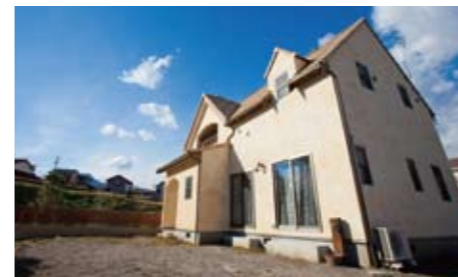
屋根は光と大地をイメージした2色の混ぜ置き。壁はオレンジ色のエイジング加工に

DATA 家族構成 / 夫婦、子供2人 延床面積 / 121.72㎡ 1階:70.38㎡ 2階:51.34㎡ 設計・施工 / ビスコッティハウス 株式会社ティーワイプラン TEL / 027-370-0081 この会社の紹介ページを見る▶P00