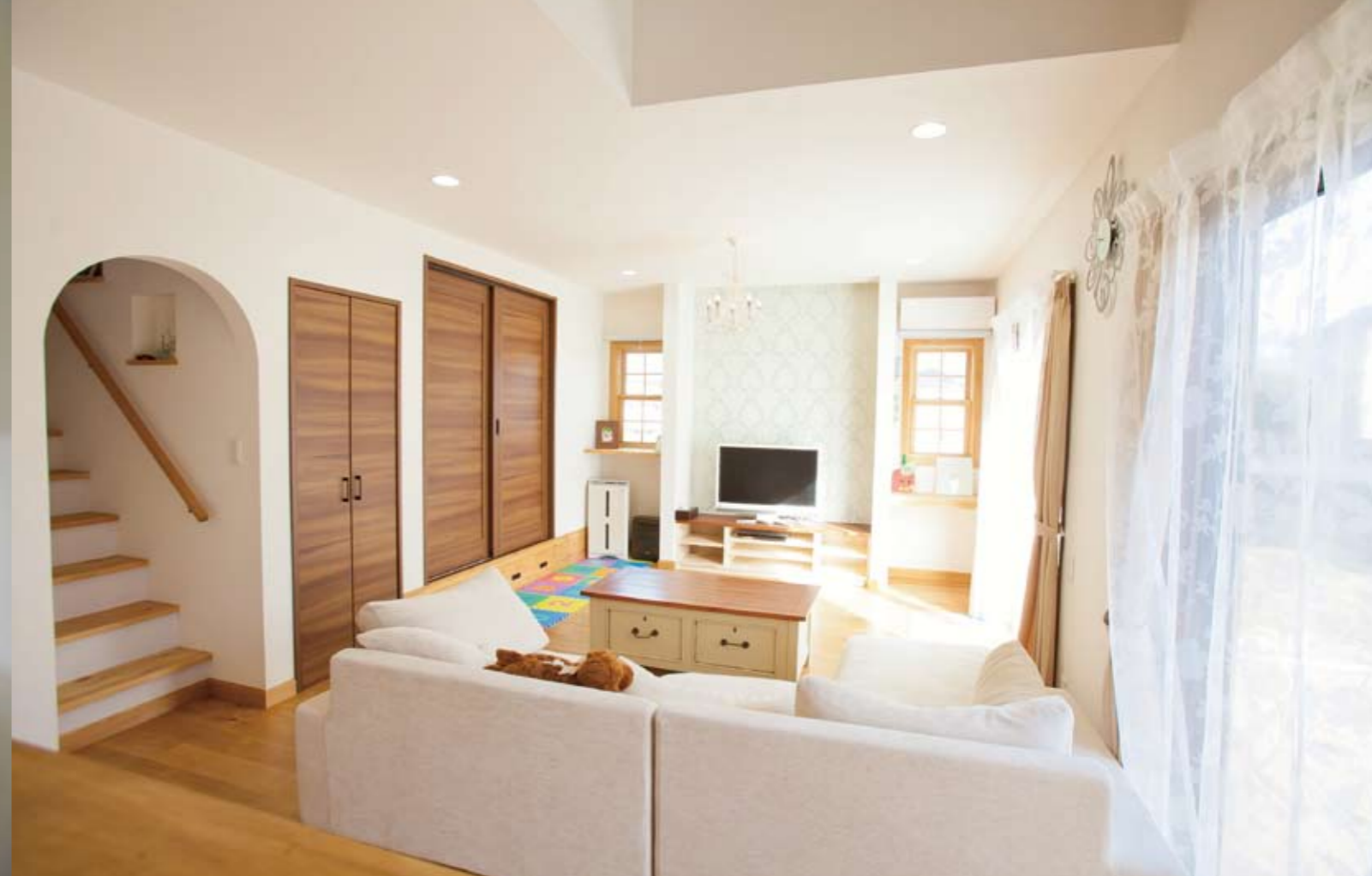
ヨーロッパアンティークを再現した。通気断熱 WB 工法で過ごしやすさも抜群だ