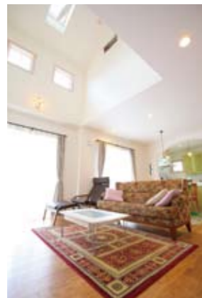
吹き抜けの天井から、明るい太陽の光を取り込んで、開放感あふれる心地良い空間に

真っ白な漆喰の壁がひととき印象的。スペイン瓦との調和も抜群で、地中海地方に建てられた家を連想させ、独特の存在感がある。 オーダーキッチンの床につかわれているのは、南欧のゴッホの寝室をイメージしてつくられ、映画でも使用されている「ペトリアア」というタイル。こだわって、わざわざ取り寄せた。 思い入れのあるモノと暮らしている。こだわりをカタチにした喜びと一緒に。それができる幸せが、ビスコッティハウスにはある。「こんな家に住みたい」という思いを叶えたい。「自分らしい」オンリーワンの家づくりをしたい。だったら、まずは相談してみる。土地探しの段階からアドバイスしてもらいたい。だから、きつと夢を実現できる。