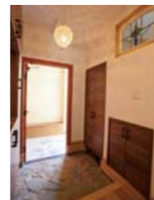
アンティークな家に暮らす夢を実現。ステンドグラスが玄関の空気を演出