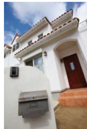
漆喰の壁の白さがひととき目を引く外観。「こんな家に住みたい」という思いを実現した