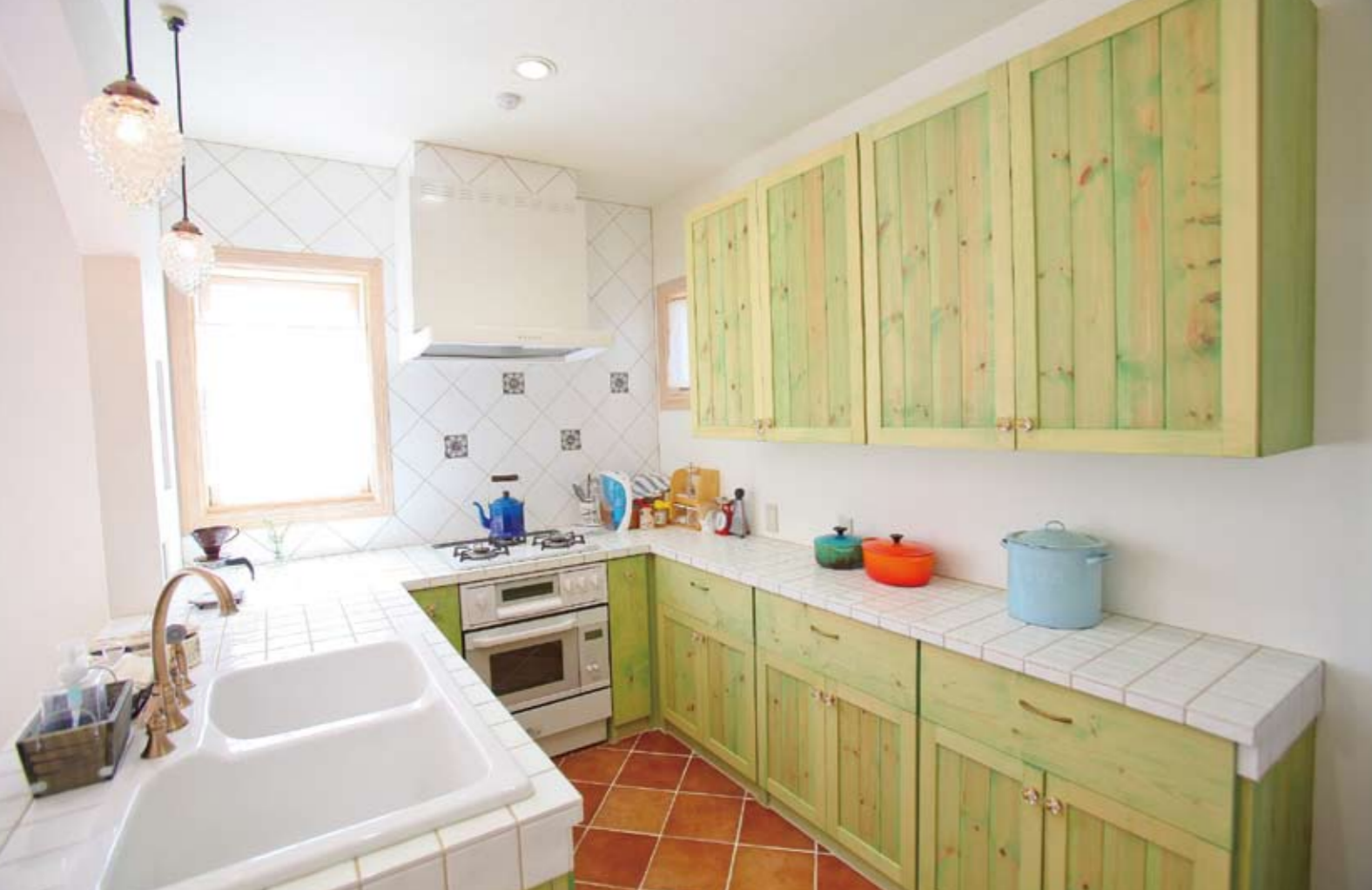
わざわざ取り寄せて使用したこだわりのタイル。キッチンもこれだけ個性的にできる