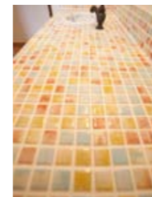
建てる前のワクワク感と住み心地の実感。自分の家建てた喜びは思った以上

住み始めて1ヶ月後の実感。「居心地の良い空間の中で、家族が笑顔でいられることが、すごく幸せです」。こだわりのイメージは、トスカナ地方の秋。玄関ドアを開けると、帰宅した家族を迎えてくれるのは、優しく輝くステンドグラス。あえてリビングと分離させたダイニングにはオーダーベンチ椅子を。トイレの手洗いはオーダーで7色のタイルを敷き詰めた。 ふと立ち寄ったオープンハウスが気に入って、ビスコッティハウスに決めた。スタッフとは、すぐに打ち解けた関係に。「イチからくり上げた実感と達成感がありました」。 振り返ってみて「何より楽しいマイホームづくりだった」と。建てる前のワクワク感も満喫しただけに、愛着もひとしおだ。