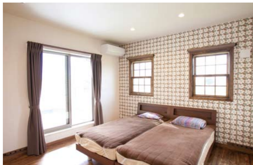
床材と窓枠に合わせて、壁紙や家具、カーテンをはじめ、布団カバーをブラウンでトータルにコーディネート