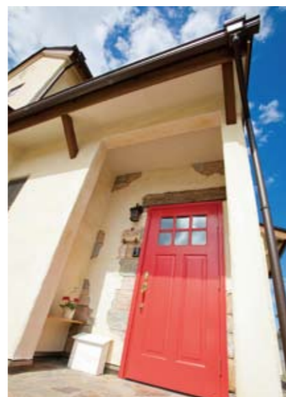
玄関は壁のラインより少し奥にレイアウト。鮮やかな赤色でペイントされた扉がアクセントになっている