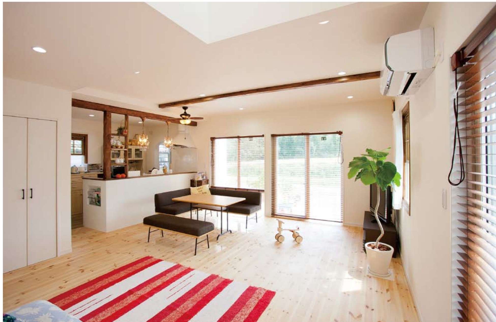
高い吹き抜けを持つ広々としたリビングは、白を基調にシンプルに。エイジング加工を施した梁やアンティークな照明がアクセント