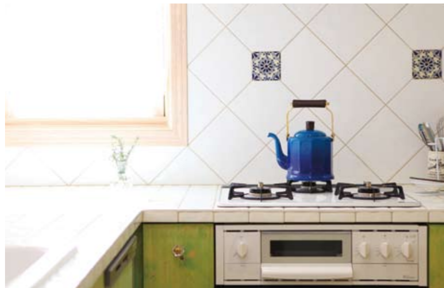
タイルを使ったオリジナル造作のキッチン、お客様にも自慢したくなる可愛らしさ