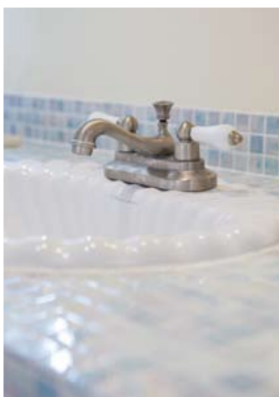
ブルーの細かいタイルを手張りした手洗いは、洗面ボウルや水栓にもこだわって、鮮度をアップ