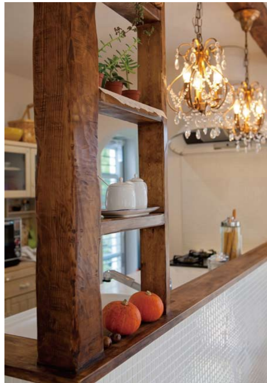
エイジング加工を施した無垢材を使った味わいのある飾り棚。アンティークテイストのライトや白いタイルをあしらった壁面がヨーロッパの田舎屋を思わせる