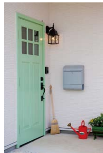
軒先や玄関回りの色や材質といった細かい部分にまでこだわりぬくことで、完成度の高い住まいを実現。どこをとっても絵になる家を提案してくれる