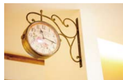
ヨーロッパの街角で見かけるような繊細な真鍮(しんちゅう)の意匠が美しい両面時計