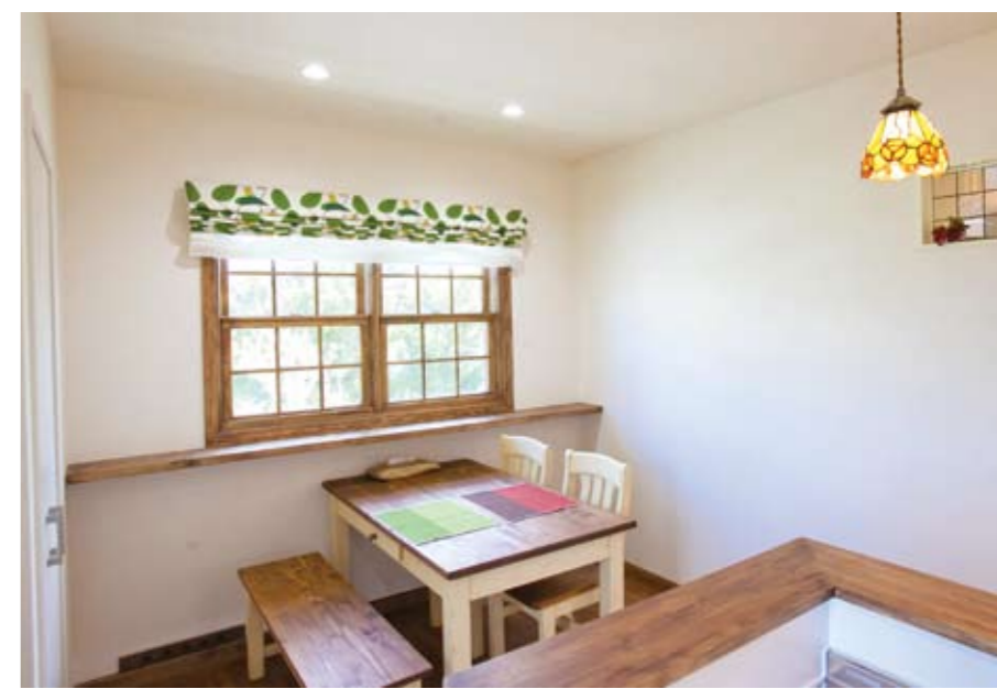
木製サッシの上げ下げ窓と作り付けの棚がカフェを思わせるダイニング。木の葉模様のシェードや小さなニッチ、スタンドグラスを施した照明でナチュラルな中に可愛らしさをプラス