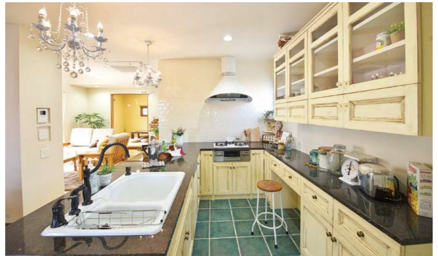
使い勝手を考えたコの字型のキッチン。天板やシンクにも自分らしいこだわりを反映させることができる