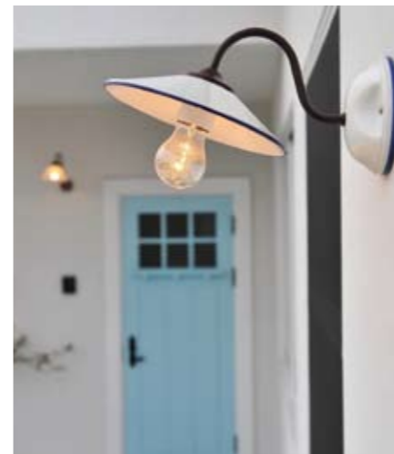
楽しみながら、家づくり。住みたかった家のイメージをしっかりと実現できる