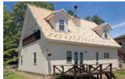
リーズナブルな価格設定ながら、好みのパーツを選んでいくうちに、個性的な家ができあがる [typeE]。たとえば外壁も、エイジング仕上げと漆喰仕上げが選べる