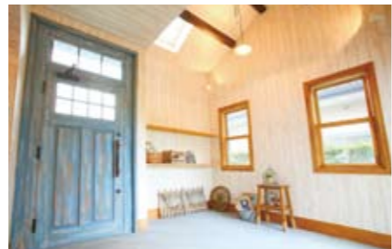
エイジング加工のスペイン瓦や木製無垢ドアが選べる [typeS]。ビスコッティハウスならではのアンティークな風合いが随所で表現できる