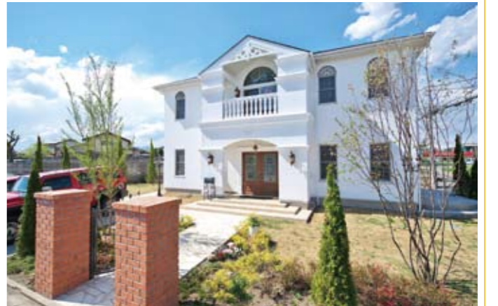
夢を実現して建てた白い漆喰の家

ビスコッティハウスは、すべての費用を含んだ資金計画の打ち合わせを何度も重ねたうえでの契約。契約後に追加費用がかかり資金計画が変更となる心配はない。住宅ローンの説明、手続きはすべて無料。ローン代行手数料などの費用も一切かからない。家づくりのあらゆることを、安心して相談できる。