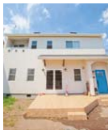
安全について、足元からしっかり考えている。だから安心

家づくりをする前に考えること。費用、デザイン、構造などたくさんあるが、案外忘れがちなのが、建物を支える地盤について。ビスコッティハウスでは地盤調査の結果、改良が必要な場合、天然砕石を用いた地盤改良工法「HySPEED 工法」を推奨。地震に強く、液状化のリスクを低減。土地の資産価値が高く保てる。CO2 排出が少なく、セメントと土を混ぜない工法のため、発がん性物質である六価クロム発生の可能性もゼロ。安全と環境について、しっかり考えた提案をしている。