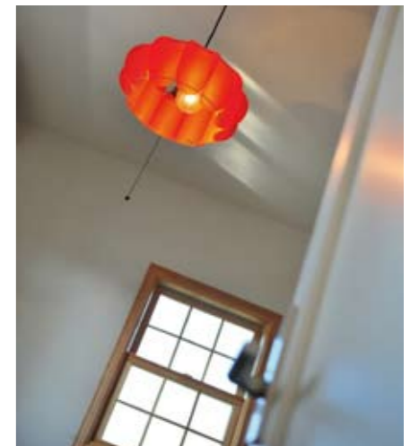
照明ひとつへのこだわりで空間の印象はがらりと変わる