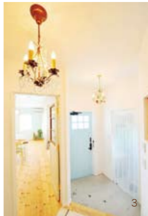
1. 細部にまでこだわった、オンリーワンの家づくりができる 2. 長く安心して暮らすことができる。まずはモデルハウスで確認してみよう 3. 遊び心を発揮して、細かいところまでこだわってしまおう

家づくりは、笑顔づくり。ビスコッティハウスのブランドコンセプトは「雑貨が似合う家」。5つこだわりをもって、お客様と一緒に家づくりを進めている。