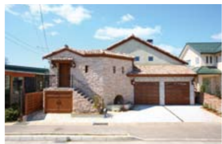
雨どいは銅製、床材にはオークとレッドパインを使用。細かいところまで、しっかりこだわられるハイエンドモデルが[typeD]

スタッフが希望をしっかりと聞いて、住宅のスペシャリストならではのアドバイスをしてくれるから、悩まず、楽しみながら家づくりを進めていける。